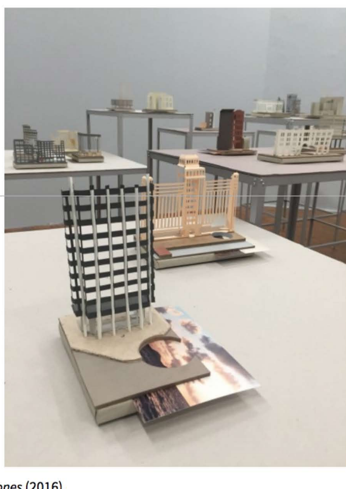
Los atolones (2016).

La muestra Nuestros más cálidos y afectuosos saludos , de Virginia Colwell (Nebraska, E.U., 1981) en la galería Marso, es por demás ejemplar en el uso de información clasificada que parte de un proceso creativo que no tiene como resultado final la exposición de un relato que instrumental y quirúrgicamente se ha borrado de la historia de Estados Unidos, el movimiento revolucionario de las Fuerzas Armadas para la Liberación Nacional (FALN) de Puerto Rico, que durante casi una década (1974 a 1983) operaron con acciones de “violencia simbólica” en Nueva York y Chicago, sino que formalmente se desprende de su soporte documental para convertirse en piezas artísticas que no pueden encasillarse en lo que tradicionalmente se conoce como una muestra de archivo.